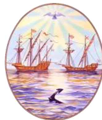
Écusson de Buenos Aires