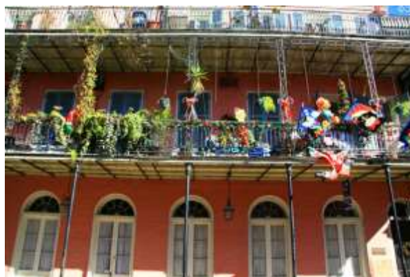
Façade de la maison Perrillat à la Nouvelle-Orléans